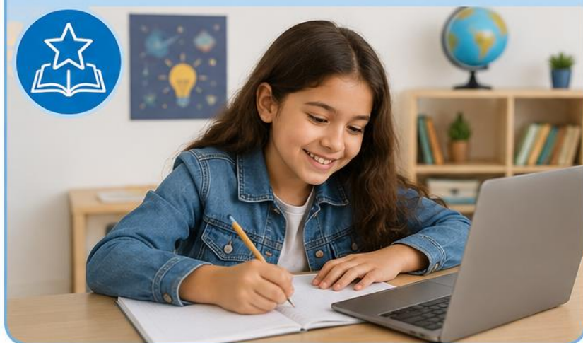
Estudiante con talento excepcional