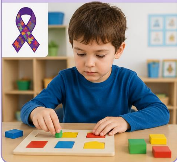
Estudiante con TEA