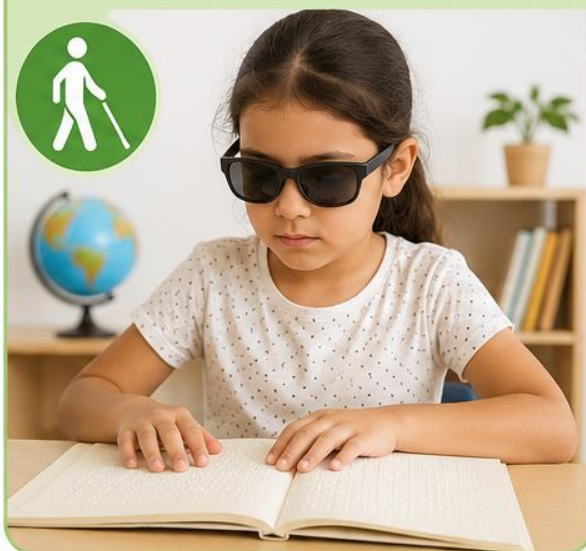
Estudiante con discapacidad visual